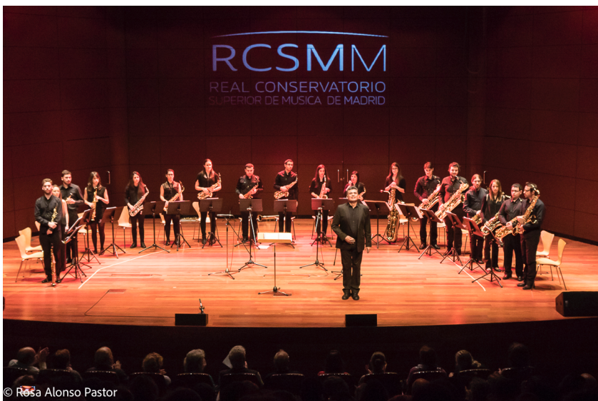
Conjunto de Saxofones del Real Conservatorio Superior de Música de Madrid en el Centro de Arte Reina Sofía