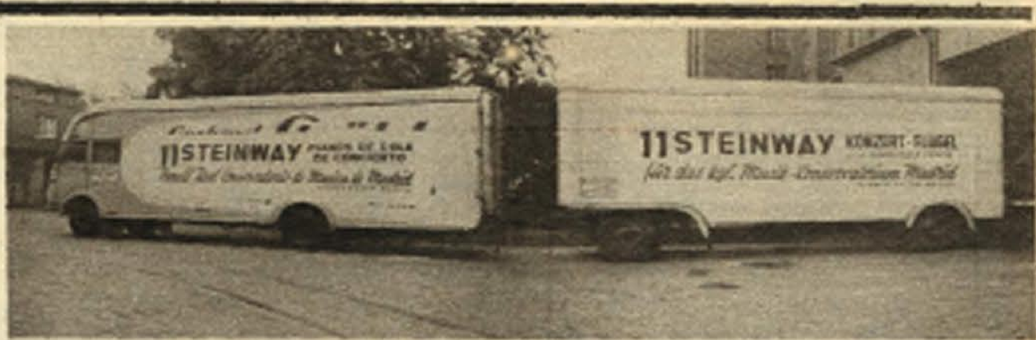
A su paso por las ciudades europeas, el transporte de los pianos a España, despertó mucho interés y afectuosas simpatías, hablando, incluso los periódicos, de este tránsito.