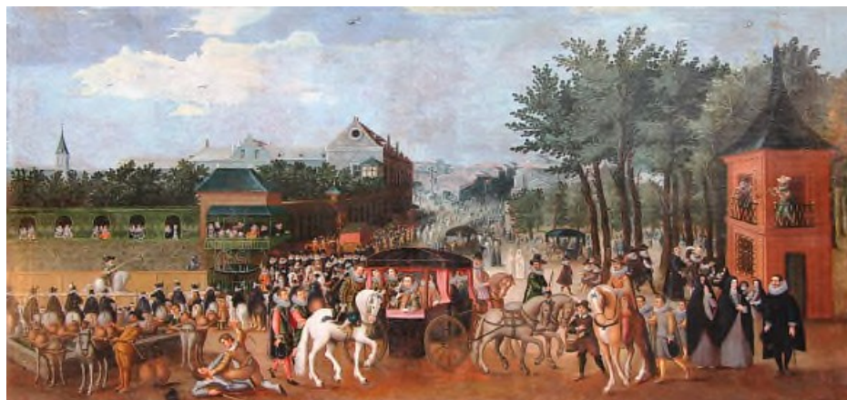
Festejo en el Prado de San Jerónimo (Anónimo, 1615?) Col. Khevenhüller-Metsch, cfr. Muñoz de la Nava Chacón